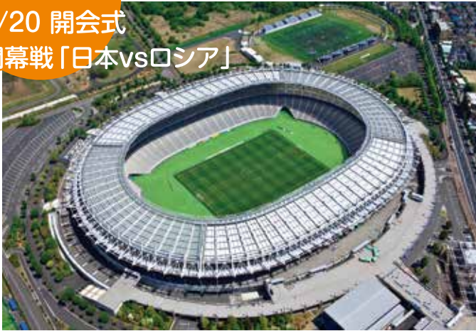
開幕戦「日本vsロシア」が行われる東京(味の素)スタジアム