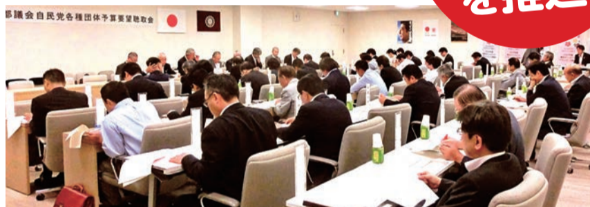
▲各種団体の皆様からの要望について意見交換する都議会自民党議員団