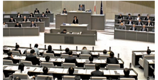
都議会第一回定例会・都議会自民党代表質問の様子

世界で一番の都市・東京の実現に全力投球。 都議会自民党は、平成27年度予算を「東京を『世界で一番の都市』に飛躍させる予算」とし、引き続き、2020年(平成32年)オリンピック・パラリンピック大会とその先の東京を見据えたまちづくりを推進し、更なる都民生活の向上と東京の発展に向けて、責任政党として全力で取り組んでまいります。