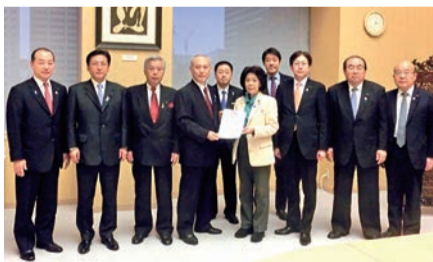
▲政策提言する政策推進総本部役員

各種団体の皆様から 予算要望を伺いました 27年度予算編成に向け、各種団体の皆様から要望を伺う「予算要望聴取会」を昨年9月に開催しました。今回も7日間におよぶ日程となり、福祉、教育、医療、環境、建設、運輸、商業、工業、農林、食品などの各種団体の皆様から切実な要望を賜りました。都議会自民党は皆様の要望の実現へ向け、予算編成に取り組みました。