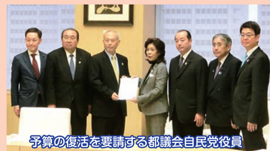
予算の復活を要請する都議会自民党役員

その結果、都議会自民党の要請が全面的に反映され、一般会計約200億円が、27年度予算に復活して計上されました。