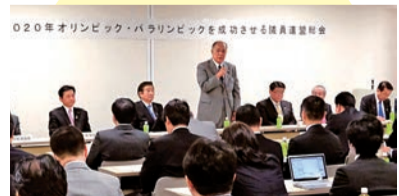
2020年オリンピック・パラリンピックを成功させる議員連盟総会の様子

世界で一番の都市・東京の実現に全力投球。 都議会自民党は、平成27年度予算を「東京を『世界で一番の都市』に飛躍させる予算」とし、引き続き、2020年(平成32年)オリンピック・パラリンピック大会とその先の東京を見据えたまちづくりを推進し、更なる都民生活の向上と東京の発展に向けて、責任政党として全力で取り組んでまいります。