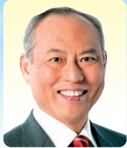
舛添要一 新都知事

The Metropolitan Assembly Activity Report