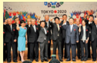
▲2020年東京オリンピック・パラリンピック招致出陣式 (H25.8)

招致を勝ち取った今、都議会自民党は、2020年大会を最高の大会とするため、引き続き全力で取組んでまいります。