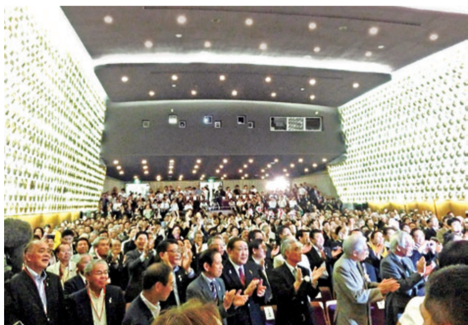
▲2020年オリンピック・パラリンピック競技大会開催都市決定を迎える会

アルゼンチン・ブエノスアイレス市で9月7日に開かれたIOC（国際オリンピック委員会）総会で、2020年オリンピック・パラリンピックの開催都市に東京が選ばれました。