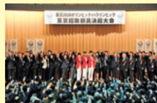
▲2020年オリンピック・パラリンピック東京招致都民決起大会 (H24.12)